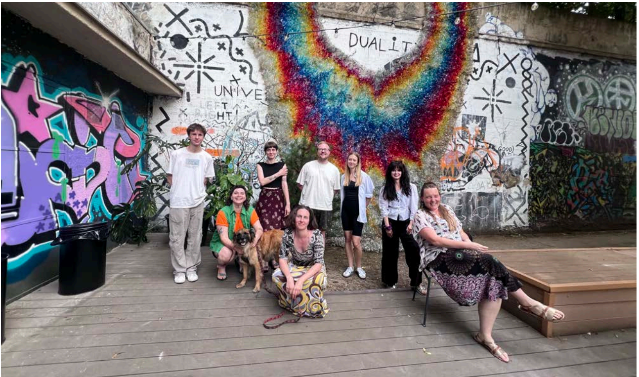
My Street Films Brno