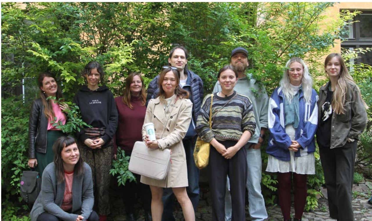
My Street Films Praha