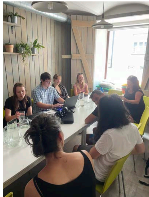
My Street Films Ostrava

Kromě čtyř osobních setkání probíhaly v rámci všech skupin také nesčetné telefonické či skupinové online konzultace, v rámci kterých měli účastníci možnost konzultovat progres svých filmových projektů. Součástí workshopu byla také online přednáška o zvuku "Umění slyšet" vedená filmařkou Violou Ježkovou. Přednáška je široké veřejnosti dostupná v podobě záznamu na našich webových stránkách.